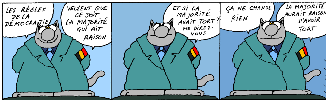
FIGURE 1 – Philippe Geluck

let lc2 = ["Eric"; "Kyle"; "Stan"; "Keny"]; let u2 = ["Keny"; "Kyle"; "Keny"; "Kyle"; "Kyle"; "Keny"; "Eric"; "Eric"; "Kyle"; "Eric"; "Stan"; "Eric"; "Eric"; "Eric"; "Stan"; "Stan"];