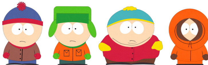
FIGURE 2 – Stan, Kyle, Eric et Keny (Southpark)

Quel est le problème? Ce phénomène se nomme paradoxe d'Arrow . Identifier les situations similaires dans l'introduction et trouver un exemple de paradoxe d'Arrow dans le paysage politique français récent, par exemple dans l'élection présidentielle de 2022.